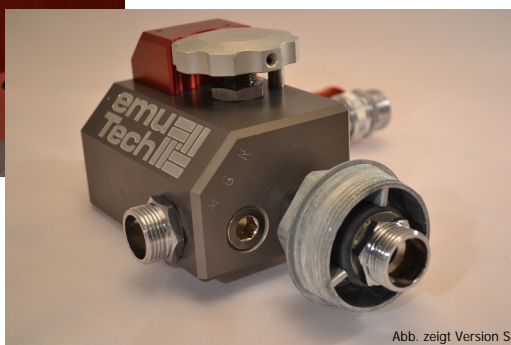
Abb. zeigt Version S

18 verschiedene Variationsmöglichkeiten VDI 3035 und DVGW und DIN EN 1717* konform ölbeständige Anbauteile automatische Faßentlüftung robuste Industrierausführung kostengünstig absolut wartungsfrei absolut bedienungsfreundlich