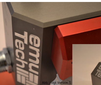
Abb. zeigt Version S